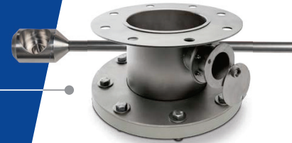
Ouverture de la pièce d'essai