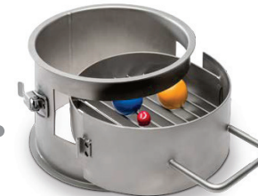
Dispositif d'arrêt de la pièce d'essai