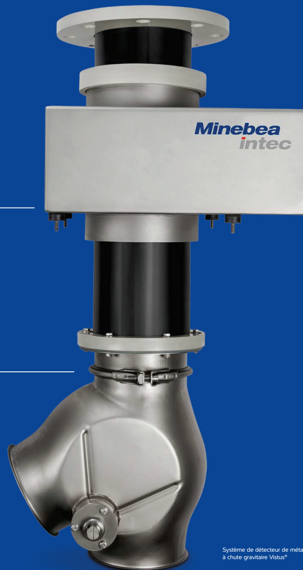
Système de détecteur de métaux à chute gravitaire Vistus®

Séparateur SW Solution adaptée à un débit très élevé de produit.