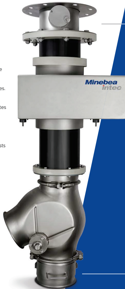
Système de détection de métaux à chute gravitaire Vistus®