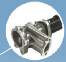
VANNE EGR DÉCALAMINÉE