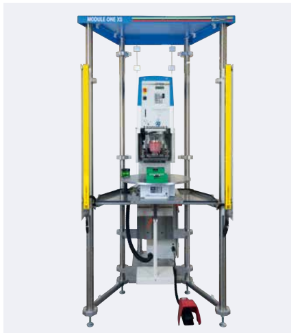
MODULE ONE XS avec machine de tampographie, HERMETIC 9-12-universal

La MODULE ONE XS se compose essentiellement d'un châssis compact, d'un carter de protection et des quatre éléments standard: plateau tournant, barrière immatérielle, table angulaire et table croisée. La machine de tampographie est à sélectionner individuellement dans les séries HERMETIC, SEALED INK CUP E et V-DUO.