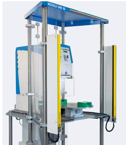
Barrière immatérielle, plateau tournant, table angulaire

La MODULE ONE XS se compose essentiellement d'un châssis compact, d'un carter de protection et des quatre éléments standard: plateau tournant, barrière immatérielle, table angulaire et table croisée. La machine de tampographie est à sélectionner individuellement dans les séries HERMETIC, SEALED INK CUP E et V-DUO.