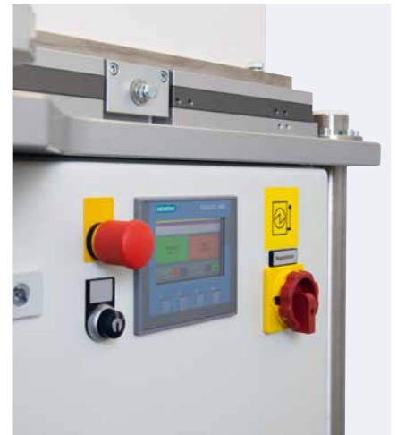
Ecran tactile pour la commande du plateau tournant

La table angulaire réglable en hauteur, associée à une surface de travail pratique, permet