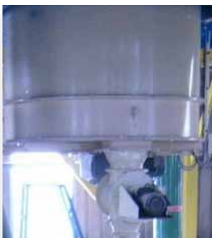
Filtre avec bras ramasseur