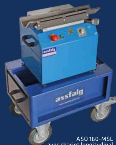
ASO 160-MSL avec chariot longitudinal