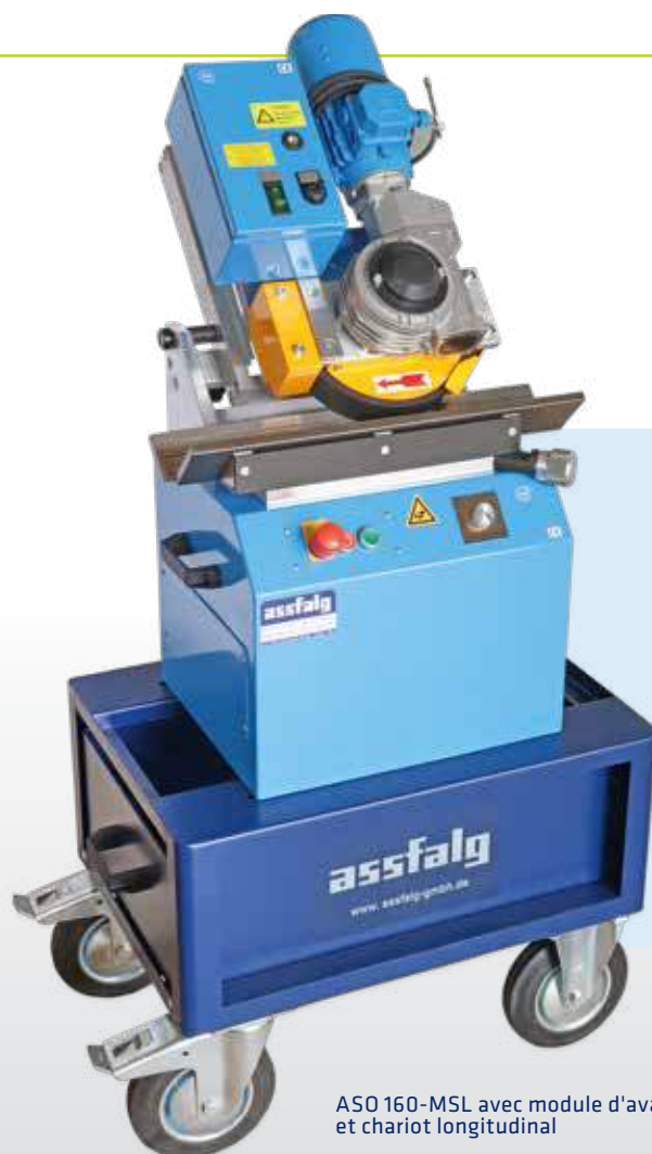
ASO 160-MSL avec module d'avance et chariot longitudinal