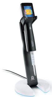
Support de chargement avec HandyStep® touch S et pointe DD tip //