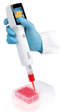
Multi-dosage avec HandyStep® touch et pointe DD tip //

Le HandyStep® touch permet d'économiser du temps et évite les erreurs grâce à la reconnaissance automatique de la taille des pointes DD tips // de BRAND avec codage breveté sur le piston. Après l'insertion, la taille de pointe détectée est affichée automatiquement. Vous pouvez désormais sélectionner le volume à doser rapidement et en toute facilité. Le réglage de l'appareil reste conservé lors de l'insertion d'une nouvelle pointe DD tip de même taille.