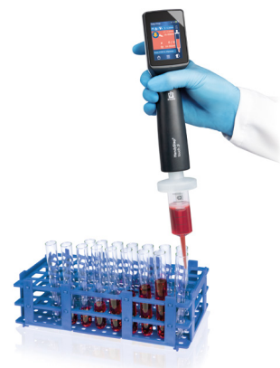
Dosage séquentiel avec HandyStep® touch S et pointe DD tip //