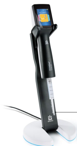
Support de chargement avec HandyStep® touch S et pointe DD tip //

En plus des pointes DD tips de BRAND, vous pouvez aussi utiliser les pointes compatibles d'autres fabricants