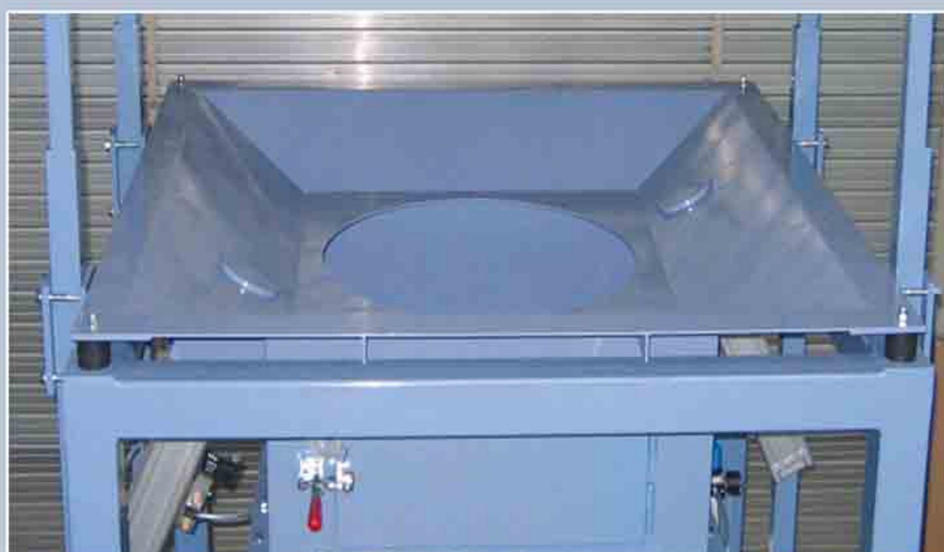
Trémie de réception du Big-Bag avec fond vibrant