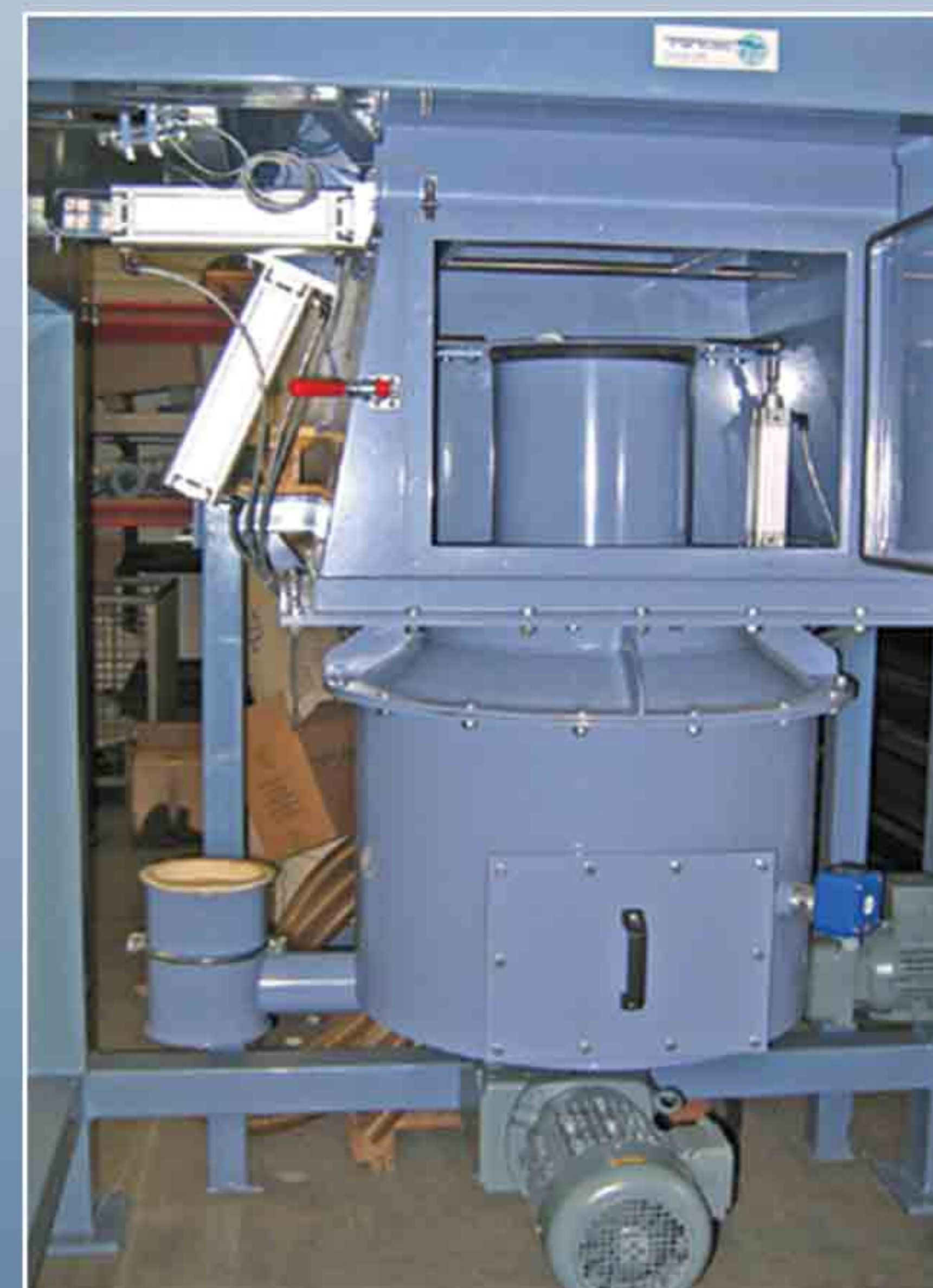
Trémie de réception matière cylindrique type DZR pour produits pulvérulents de mauvais écoulement