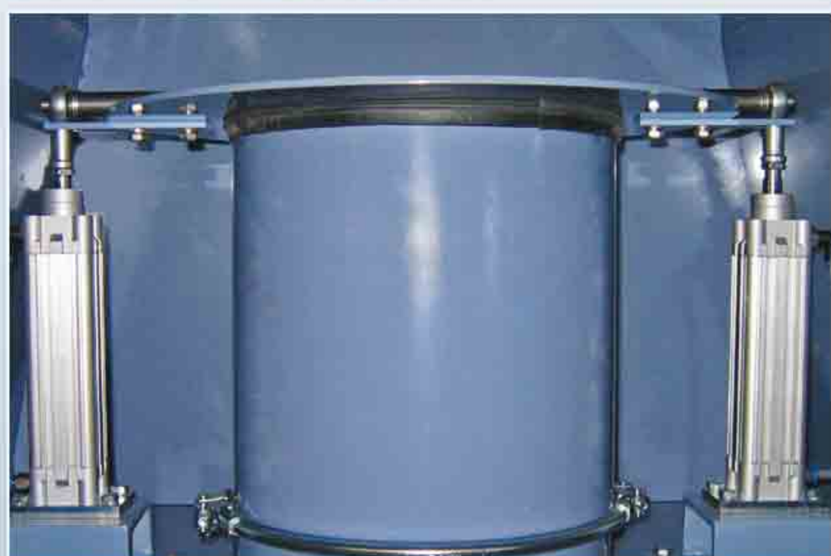
Dispositif de fixation de la goulotte d'écoulement du Big-Bag