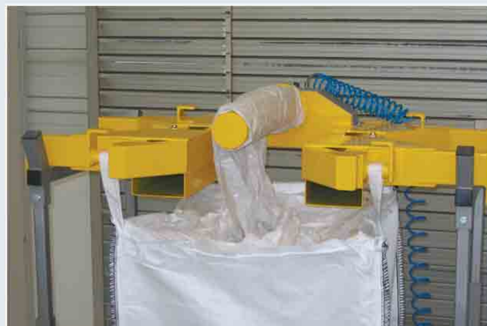
Châssis de fixation de Big-Bag muni d'un dispositif pour enrouler le sac intérieur (inliner) du Big-Bag