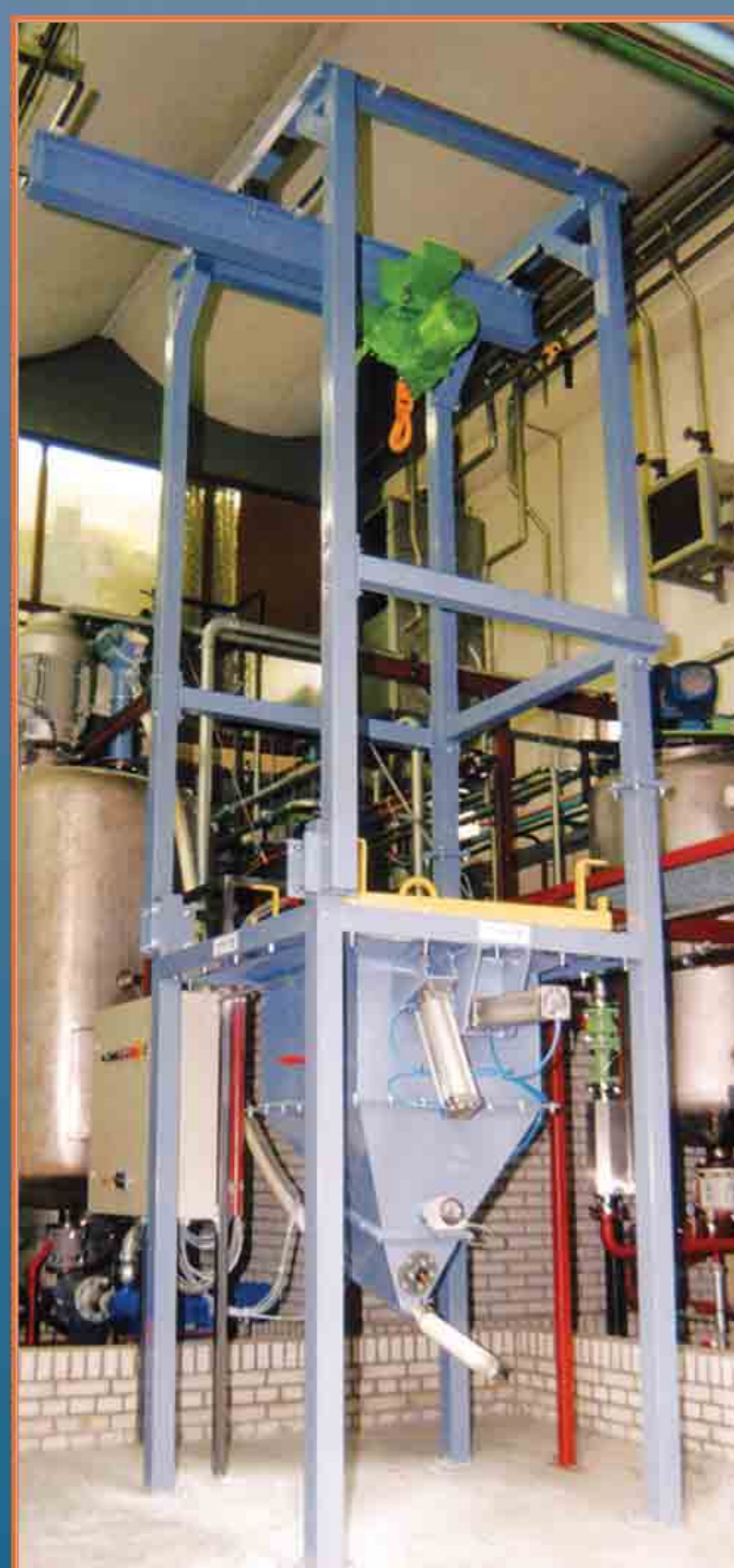
Station de vidange Big Bag avec palan intégré pour le chargement et le positionnement du Big-Bag