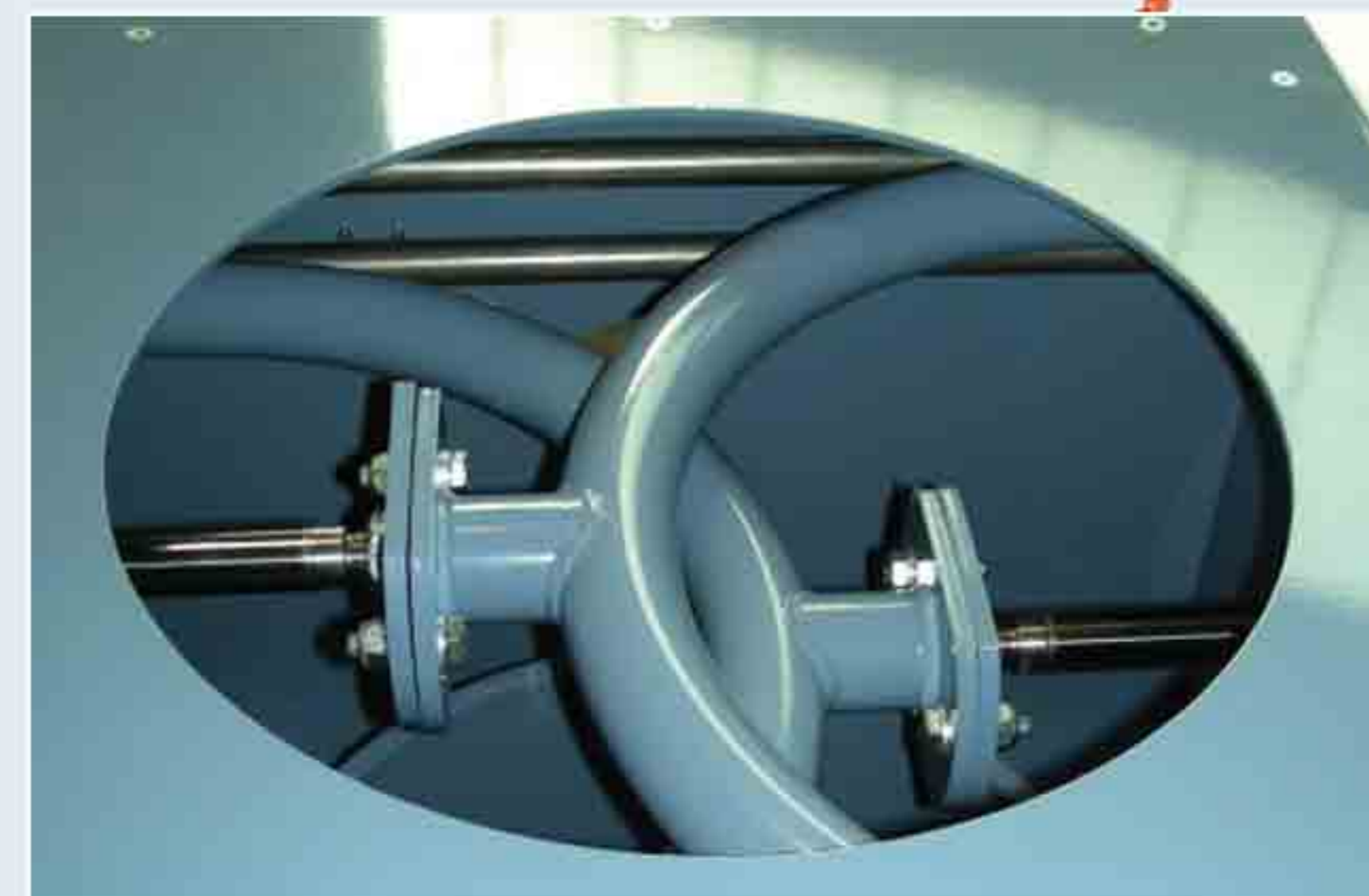
Dispositif de fermeture de la goulotte d'écoulement du Big-Bag