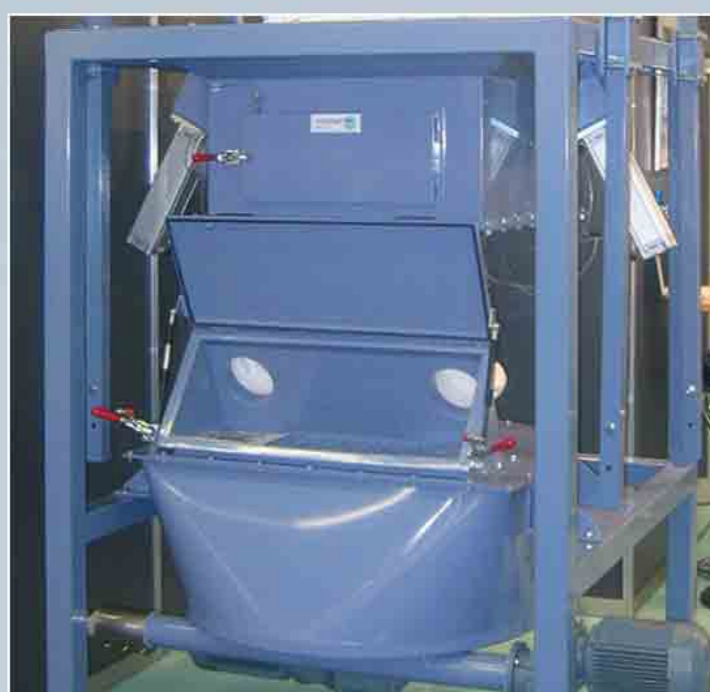
Station combinée pour la vidange de Big-Bag et de sacs