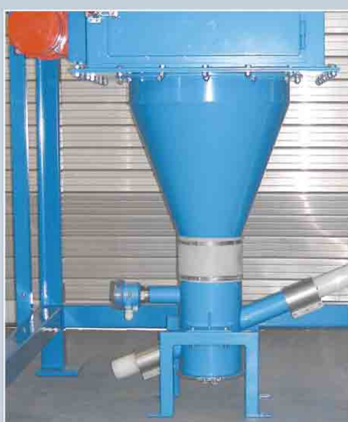
Trémie de réception matière conique type RF pour produits de bon écoulement avec alimentateur de reprise type FR