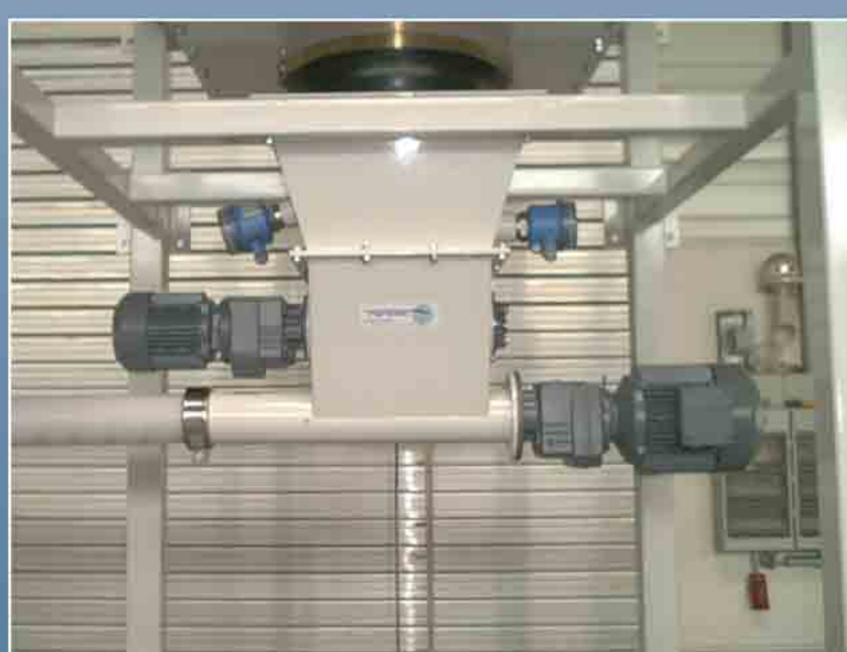
Trémie de réception matière type FW avec système de dévoutage horizontale