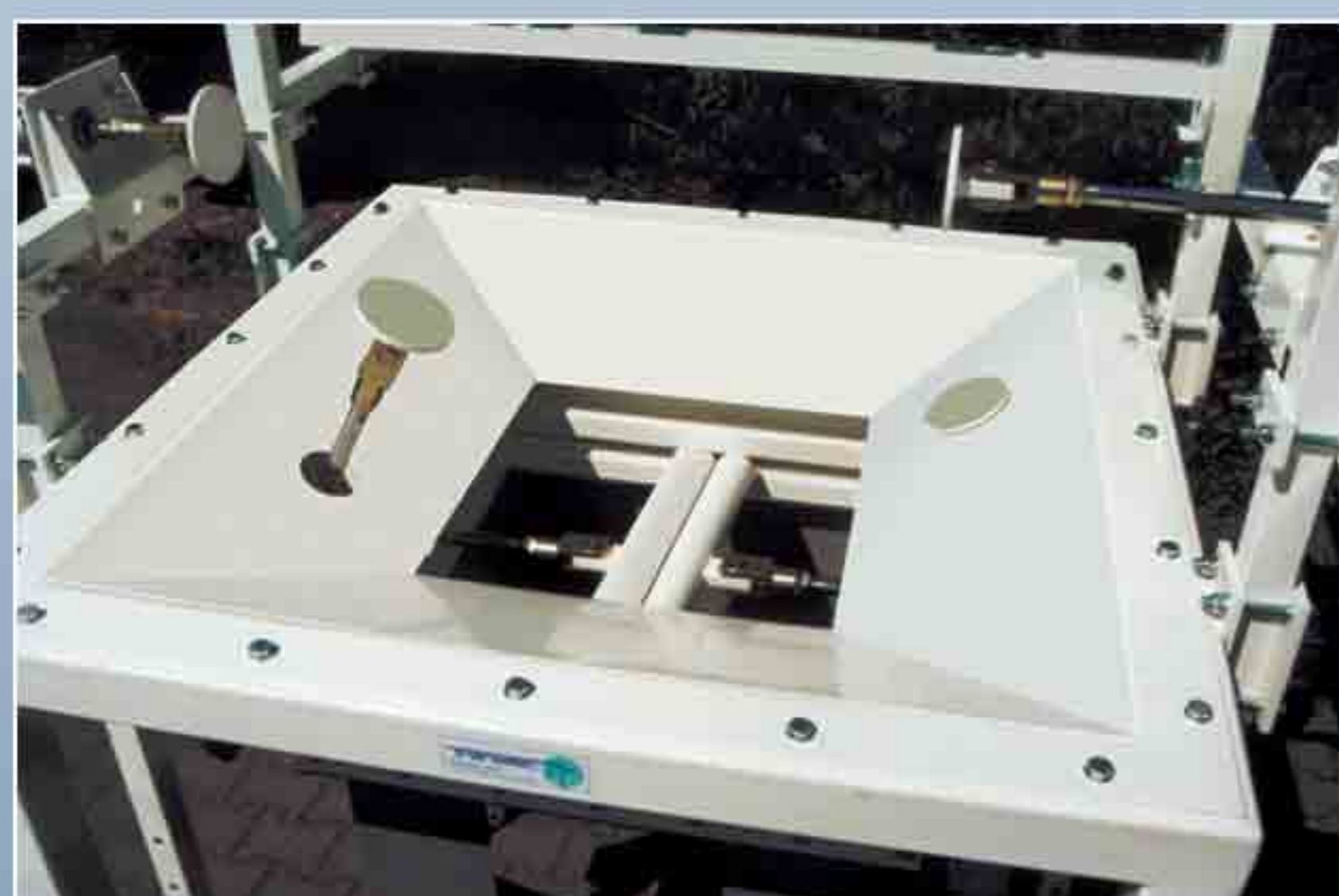
Massage du Big-Bag à l'aide de vérins pneumatiques afin d'assurer le dévoutage de produits de mauvais écoulement