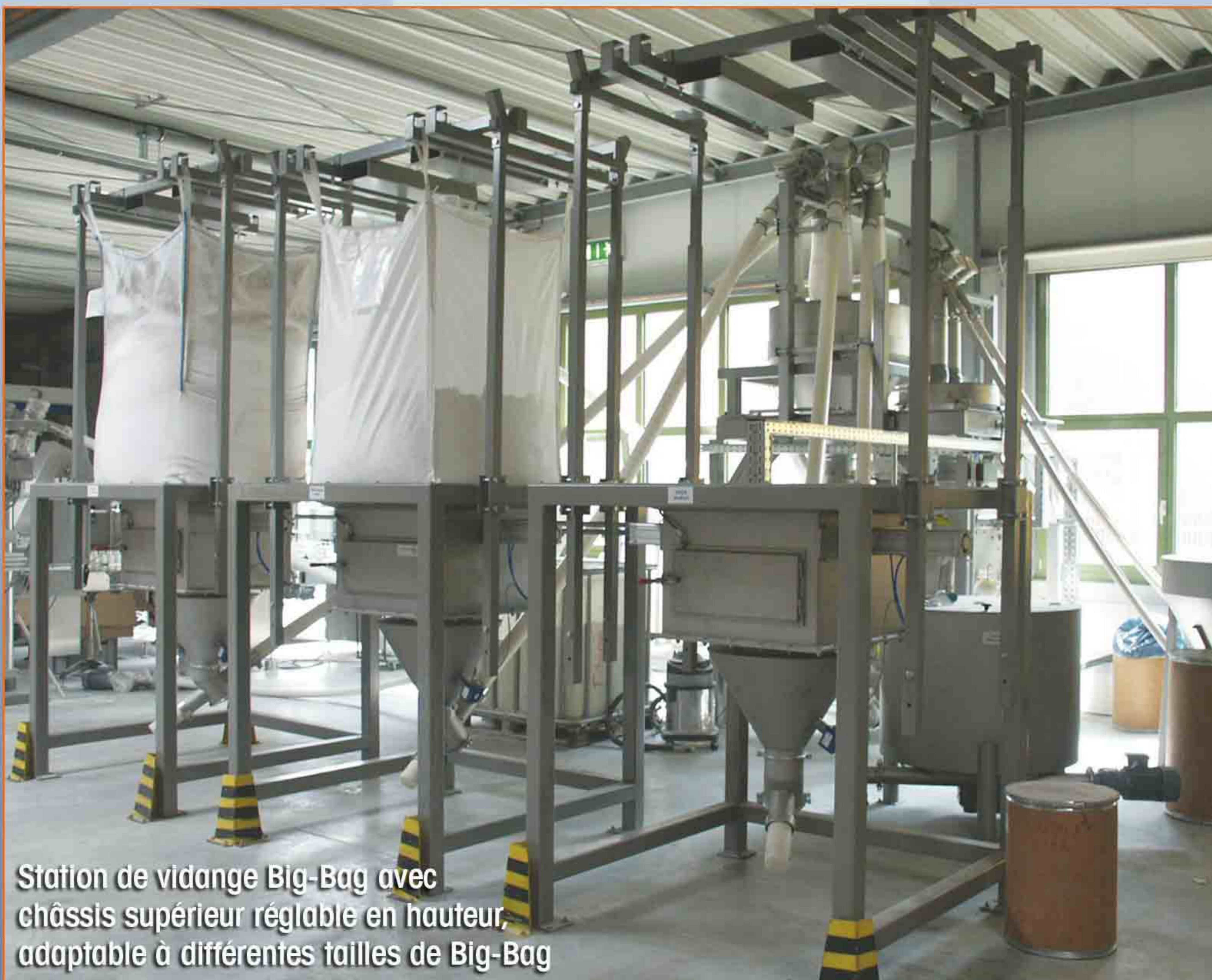
Station de vidange Big-Bag avec châssis supérieur réglable en hauteur, adaptable à différentes tailles de Big-Bag