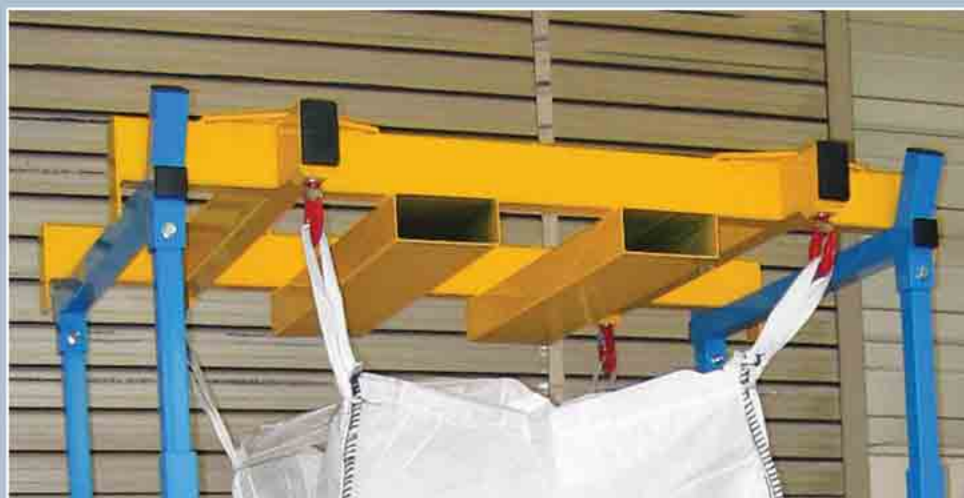
Châssis de fixation de Big-Bag avec dispositif de guidage pour fourches de charriot élévateur