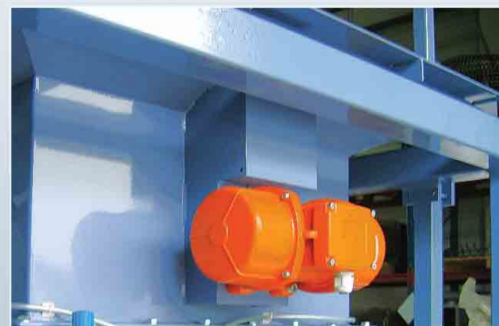
Vibreux électrique pour trémie de réception vibrante