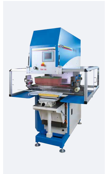
TSM 130 universal kit de raclage transversal