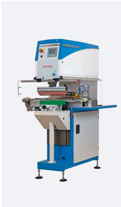
TSM 60/90 universal kit de raclage transversal

Les versions avec entraînement servo-mécanique se distinguent par leur nombre de cycles et leur force d'impression très élevés. Lors de la cinématique du déplacement de la racle ou du tampon, l'efficacité énergétique ainsi que le montage du châssis de la machine arrondissent le concept de machine réussi.