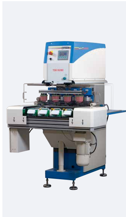
TSM 60/90 universal polychrome Solo