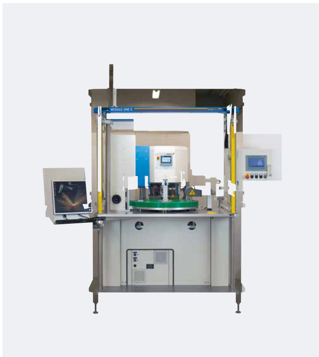
Automation MODULE ONE S Impression en 2 couleurs

Construction de machines « made in Allemagne » justement.