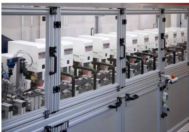
12x RAPID 2000/1 Automation linéaire