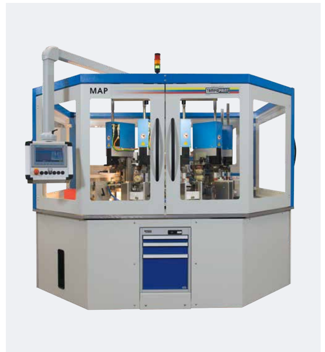
Automation MAP Equipement variable