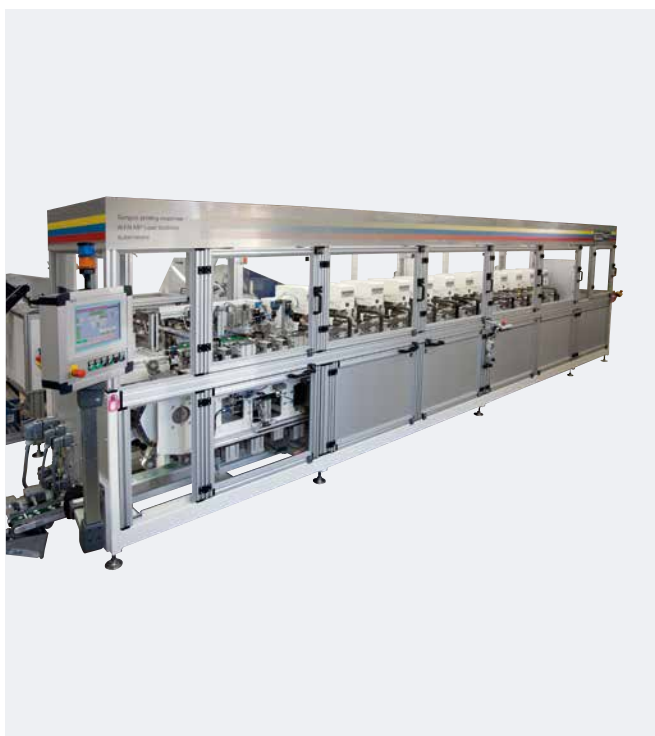
Automation en 12 couleurs avec RAPID 2000/1