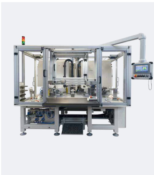
Automation en 4 couleurs avec HERMETIC 13-12 universal