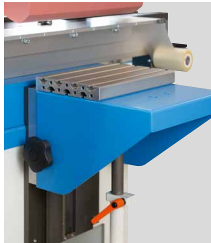
Table angulaire réglable en hauteur

L'équipement de base de cette machine de tampographie comprend un châssis de base avec un espace de rangement pratique. Ce châssis garantit également une position ferme et conduit à une grande stabilité. La flexibilité