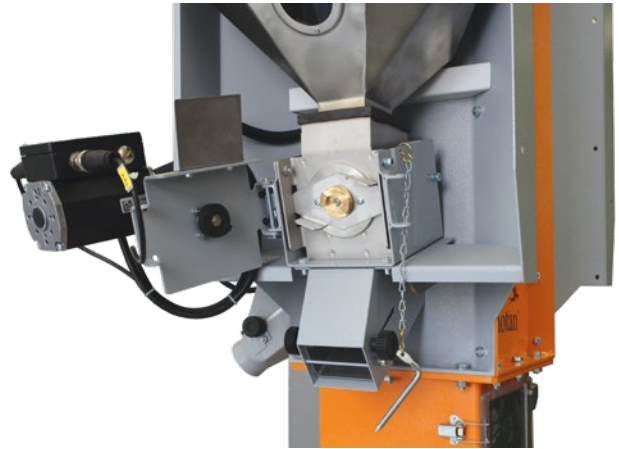
Vis de dosage montée sur roulement unilatéral, équipée d'un raccord à démontage rapide.