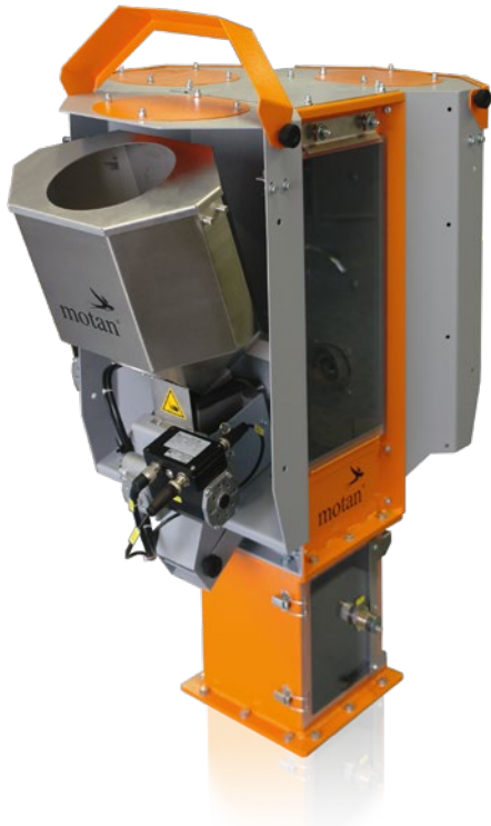
Système rapide de changement