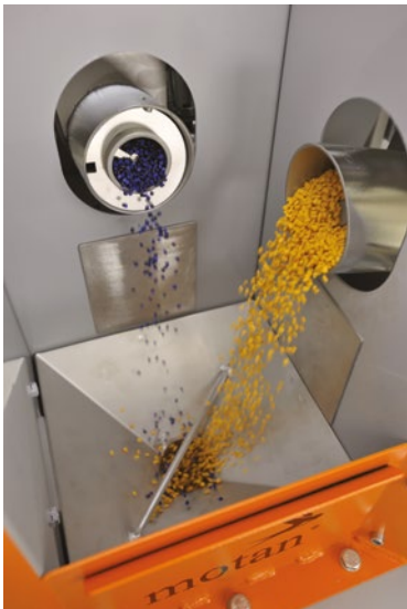
Système de mélange par gravité