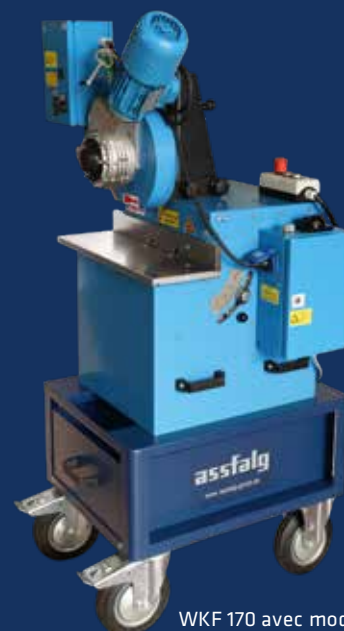
WKF 170 avec module d'alimentation et chariot