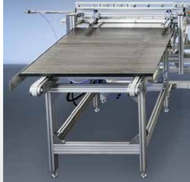
WKF 170 comme fraiseuse d'arête avec module d'avance et transporteur à rouleaux

Fraiseuse automatique de bord ZE 2000/2 d'ASSFALG