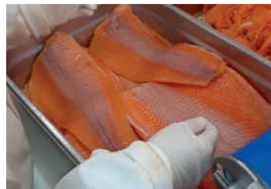
Truite fumée sortant de la peleuse V1258