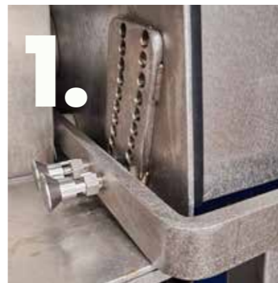
La machine V1258 dispose d'un système de réglage d'épaisseur à crans.