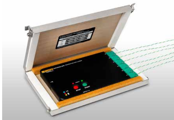
Enregistreur Datapaq DP5 et son bouclier thermique

L'enregistreur Datapaq DP5 est disponible avec l'option TM21 pour une transmission radio des mesures. Cette option, conçue pour assurer le transfert des données sous haute température, a déjà prouvé son efficacité dans des applications aussi différentes que les cuissons en agroalimentaire ou les réchauffages de brames en sidérurgie.