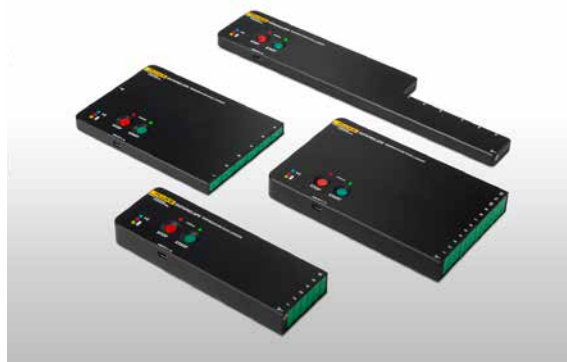
Enregistreur Datapaq DP5

Le logiciel « Reflow Insight » standard inclut un outil de calcul de prédiction de recette « Easy Oven Set up (EOS) » qui analyse les données pour informer l'utilisateur sur les réglages optimaux du