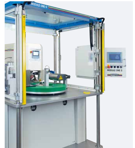
Ergonomie : Console de commande pivotante facile d'utilisation

La construction et l'assemblage ont pu être réduits grâce à la standardisation de tous les sous-ensembles et options. Seuls les posages seront fabriqués sur commande. En fonction des attentes liées à l'application, le choix est