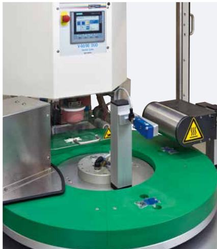
Posages multifonctions entourés d'une machine de tampographie et autres composants

La semi-automatique MODULE ONE S est utilisée pour des applications simples. Le chargement et le déchargement des pièces à marquer et marquées se font manuellement.