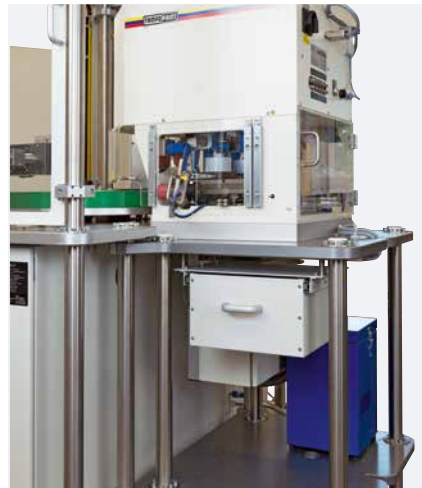
Extension du satellite à l'arrière de la machine avec un accès facile aux unités d'impression

La MODULE ONE S est constituée d'un châssis, un plateau tournant et un satellite machine. Pour ce dernier, les machines de tampographie des séries HERMETIC, SEALED INK CUP E ainsi que V-DUO sont disponibles. Les autres postes peuvent être équipés librement avec composants.