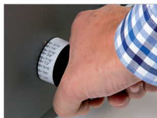
Molette pour ajuster le système de pression au diamètre de la reliure.