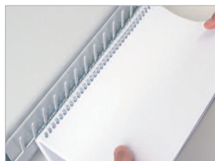
Peigne de positionnement de l'élément de reliure.