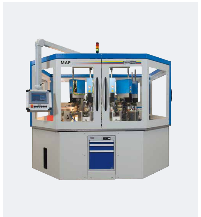
Automation MAP Plaquettes bottelpack