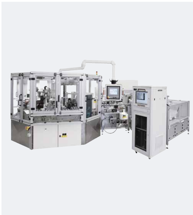
Automation Tampographie rotative Stylos à insuline

Notre construction « made in Germany » soutenue par des employés du service commercial hautement qualifiés, conduite de projet, technique ainsi que service avant et après la vente assurent à nos clients une réalisation professionnelle du concept à la production allant jusqu'à 24h.