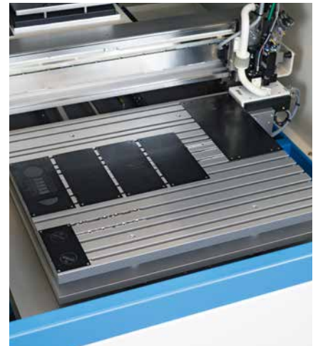
Plaque réceptrice pour les clichés

Le CLICHE LASER Xi dispose d'une table de support de cliché sur laquelle les clichés sont fixés par des rainures en T. Ceci permet une précision de positionnement absolue de l'image imprimée sur le cliché. Grâce à la construction à plat et à la construction compacte de la machine, les temps d'équipement dans le système laser sont considérablement