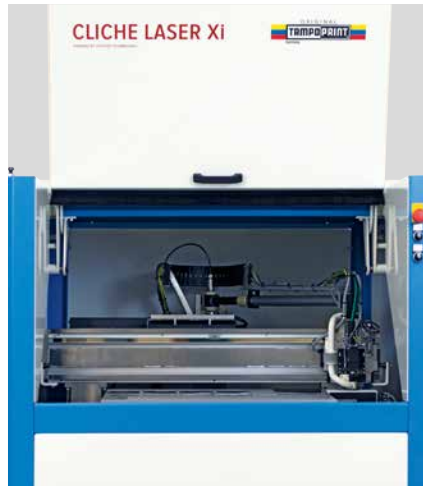
Chambre de travail

Le nombre de diodes laser installées dépend de la vitesse requise par le client. Une mise à