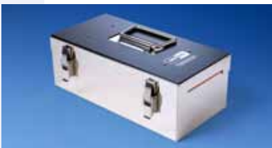
Bouclier thermique TB0050