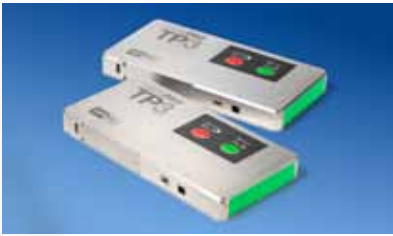
Enregistreurs de données TP3016 et TP3026