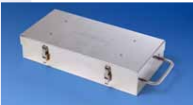
Bouclier thermique TB5050