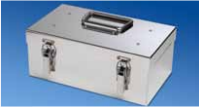
Bouclier thermique TB0021