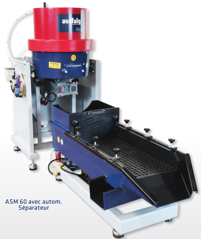
ASM 60 avec autom. Séparateur

Les installations à force centrifuge ASM sont idéales pour les petites pièces. Grâce à une intensité d'usinage plus élevée, elles ébavurent 10 à 20 fois plus vite que des machines de doucissage. L'installation à force centrifuge peut être utilisée comme dispositif unique, tout comme installation entièrement automatique.