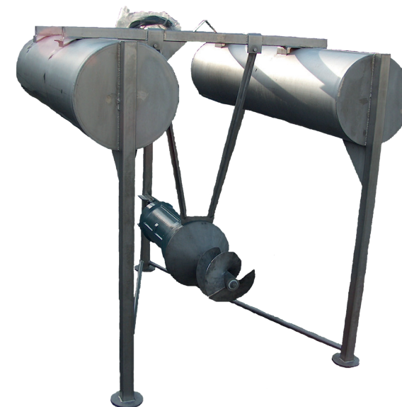
MIX-SL sur structure flottante