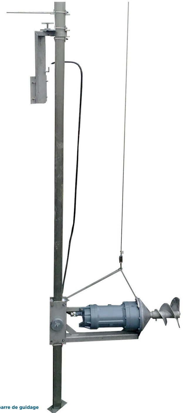
MIX-SL sur barre de guidage